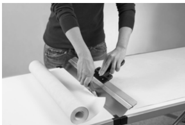
Раскрой обоев на полотна

Общим правилом является следующее: основание должно быть сухим, прочным, способным равномерно впитывать влагу, чистым, нейтральным и гладким.