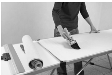
Нанесение клея на полотно обоев

Раппорт: полотна обоев с рисунком прямоугольного типа должны быть одинаковы. Просто положите обои друг на друга так, чтобы совмещались их края, учитывая при этом обозначения на раппортах, и раскраивайте их на полотна желаемой длины. При раскройке обоев со смещением рисунка на каждом втором полотнище рисунок соответственно сдвигается на указанный на вкладыше размер, т. е. происходит сдвинутая подгонка.