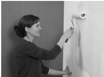
Клей наносится прямо на стену...

Внимание! Флизелиновые обои должны наклеиваться на основание однородного цвета. Поэтому мы рекомендуем нанести пигментированный фон под обои.