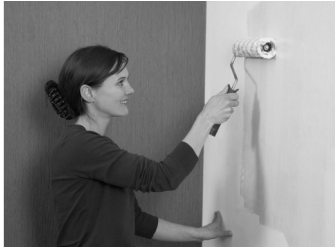
Der Kleister kommt direkt auf die Wand...

Alte, sandende Putze grundieren Sie am besten mit wasserbasiertem Tapeziergrund. Wichtig : Vliestapeten benötigen einen farblich einheitlichen Untergrund. Wir empfehlen deshalb das Auftragen eines pigmentierten Tapetengrundes.