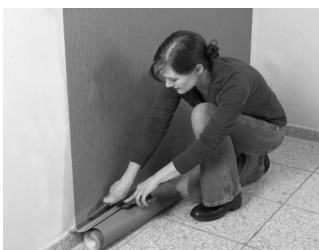
... und abgeschnitten - fertig!

Die Vliestapete kann nach dem Einkleistern der Wand direkt ohne Weichzeit in das Kleisterbett eingelegt und abgerollt werden. Drücken Sie die Bahnen mit einer Tapezierbürste/-wischer oder Moosgummiwalze blasenfrei an.